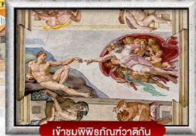
เข้าชมพิพิธภัณฑ์วาติกัน