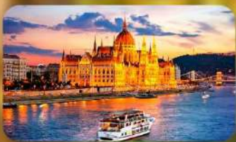
ล่องเรือแม่น้ำดานูบ ช่วง Twilight พร้อมจิบแชมเปญ