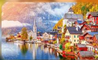
การินตีพิก Hallstatt/St.Wolfgang หรือริมทะเลสาบ 1 คืน