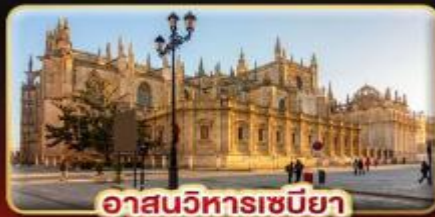
อาสนวิหารเซบิยา