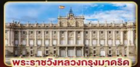
พระราชวังหลวงกรุงมาดริด