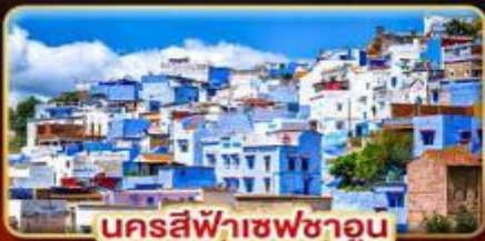
นครสีฟ้าเซฟซาอูน

เดินทาง: 18-27 ต.ค. | 02-11 ส.ค. 69 27 ส.ค. 69 - 05 ม.ค. 70