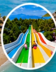
สวนน้ำ (Water Park)