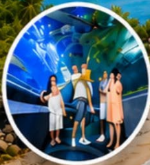
โซนอควาเรียม (Aquarium)