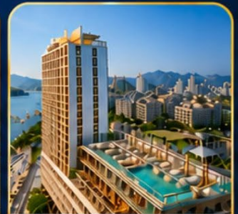
Le's Cham Hotel Nha Tran'