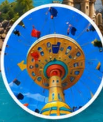
โซนเครื่องเล่น (Amusement Rides Zone)