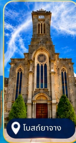
โบสถ์ญางาง