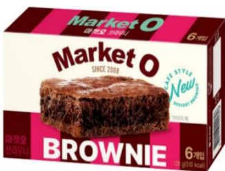
Market O Real Brownie (20g x 6cookie)