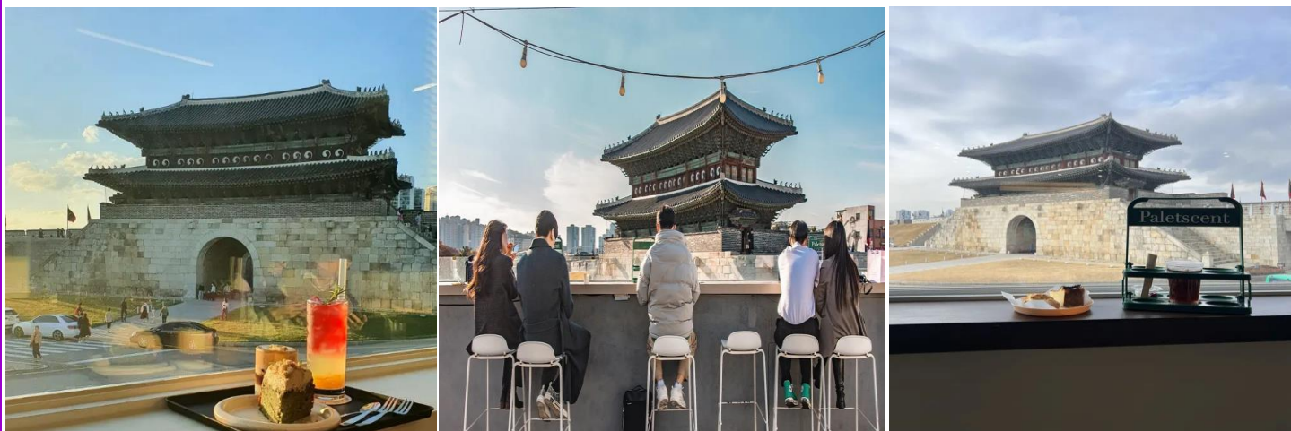
เห็นป้อมฮวาซองได้แบบ 180 องศา เป็นอีกหนึ่งสถานที่เดทอยอดฮิตของหนุ่มสาวชาวเกาหลีด้วย

ลงโทษโดยการชังองค์ชายไว้ในถังข้าวและให้ถอดข้าวอดน้ำ พอผ่านไป 7 วันจึงสิ้นพระชนม์ภายในถังข้าว กำแพงป้อมฮวาซอง มีความยาวถึง 5.5 กิโลเมตร มีป้อมปราการ หรือประตูเมือง ทั้งหมด 4 ทิศ และมีรูปแบบทางสถาปัตยกรรมที่ยิ่งใหญ่และงดงาม จากนั้นนำท่านสู่ Café Paletscent ร้านกาแฟในเมืองซูวอนที่มีมุมถ่ายรูปชิค ๆ หลายมุม บนชั้นสองของร้านสามารถมองเห็นวิวประตูจางอันมุน ประตูฝั่งทางด้านทิศเหนือของป้อมฮวาซอง และในส่วนของชั้น3 ชั้นคาเฟ่เป็นอีกมุมที่สายคอนเทนต์ สายถ่ายรูปห้ามพลาด สามารถถ่ายรูปออกมา