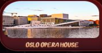
OSLO OPERA HOUSE

รหัสโปรแกรม : SEK156 9วัน 6คืน เช่าสติกโฮล์ม-ออกโคเปนเฮเกน