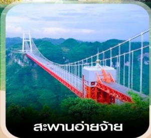
สะพานอ้ายจ้าย