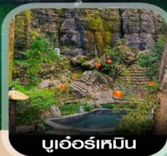
บูเออร์เหมิน