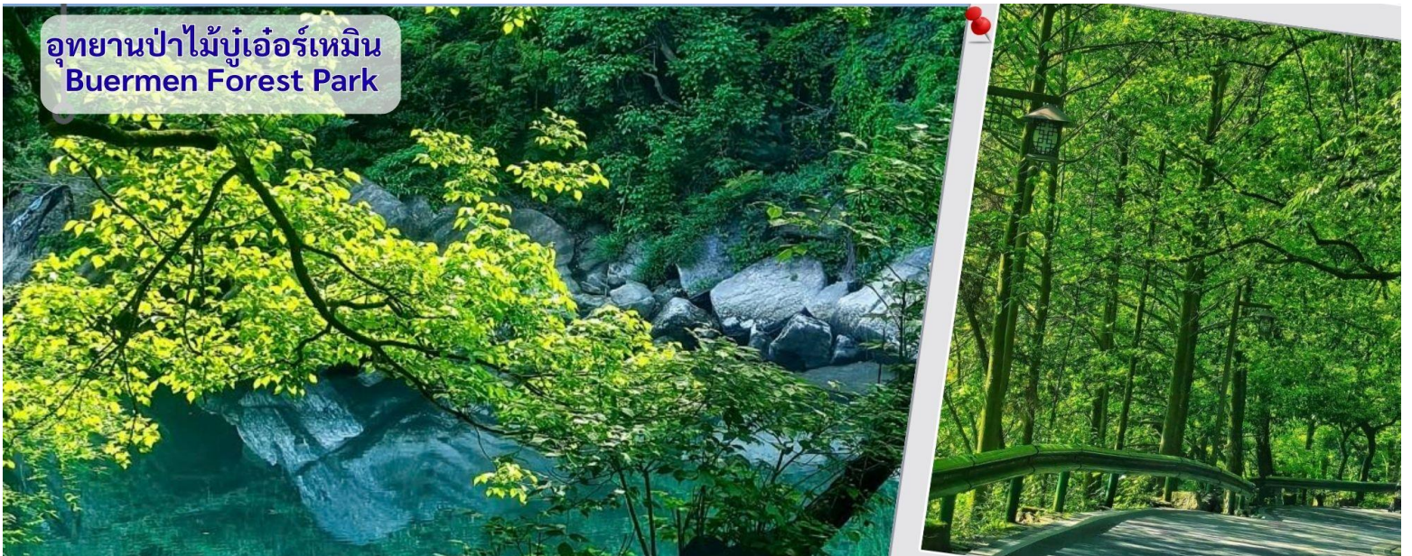
อุทยานป่าไม้บูเออร์เหมิน Buermen Forest Park

นำทุกท่านเดินทางสู่ อุทยานป่าไม้บูเออร์เหมิน (วนอุทยานแห่งชาติหูหนาน จางเจียเจี๋ย) อุทยานแห่งนี้ได้รับการประกาศเป็น อุทยานป่าไม้แห่งชาติของจีน (National Forest Park) ในปี 2006 เป็นสถานที่ท่องเที่ยวทางธรรมชาติและวัฒนธรรม ตั้งอยู่ใน จังหวัดเซียงซี มณฑลหูหนาน ซึ่งเป็นพื้นที่ใกล้เคียงกับเมืองจางเจียเจี๋ย (ประมาณ 2 ชั่วโมงจกจางเจียเจี๋ย) ครอบคลุมพื้นที่กว่า 5,000 เฮกตาร์ โดยมีพื้นที่ป่าไม้ถึง 92% ของอุทยาน โดดเด่นในเรื่องของโขดหินรูปทรงประหลาด บ่อน้ำพุร้อนธรรมชาติ และงานแกะสลักหินโบราณ โดยเฉพาะเพื่อแช่น้ำพุร้อนและชมธรรมชาติภูเขาหินสวย ๆ