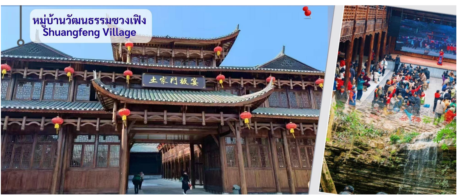
หมู่บ้านวัฒนธรรมชวงเฟิง Shuangfeng Village