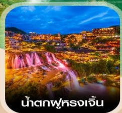
น้ำตกฟงเจิน

สัมผัสสายหมอกแห่งขุนเขา สะพานอ้ายจ้าย แบบพาโรนามา แช่น้ำพุร้อนกลางธรรมชาติ อุทยานป่าไม้บูเออร์เหมิน ชมความอลังการ น้ำตกฟงเจิน หมู่บ้านโบราณผู่หงเจิน