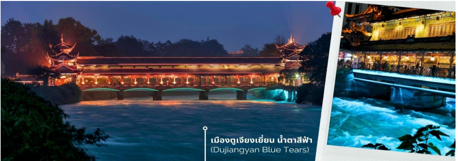
เมืองตูเจียงเยียน น้ำตาสีฟ้า (Dujiangyan Blue Tears)