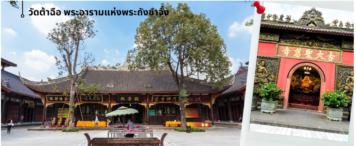
วัดต้าฉือ พระอารามแห่งพระถังซำจั๋ง

เดินทางกลับเชิงตุ้ม วัดต้าฉือ พระอารามแห่งพระถังซำจั๋ง ใจกลางนครเฉิงตู พระถังซำจั๋ง ได้รับการสรรเสริญว่า เป็นผู้มีความเพียร และมีชื่อเสียงมายาวนานกว่า 1,400 ปี และยังได้รับการยกย่องว่าเป็น พระไตรปิฎกแห่งราชวงศ์ถัง พุทธประวัติของพระถังซำจั๋งถูกจารึกในสถานที่ต่างๆมากมาย รวมไปถึงได้ถูกกล่าวถึงในจดหมายเหตุหลายเล่ม ตามเส้นทางเดินทางแห่งความเพียรของท่าน รวมทั้งมีพระอัฐิของท่าน ประดิษฐานอยู่ในพระอารามของนครนานจิง และที่ทะเลสาบสุริยันจันทราเป็นเกาะใต้หวั่นอีกด้วย