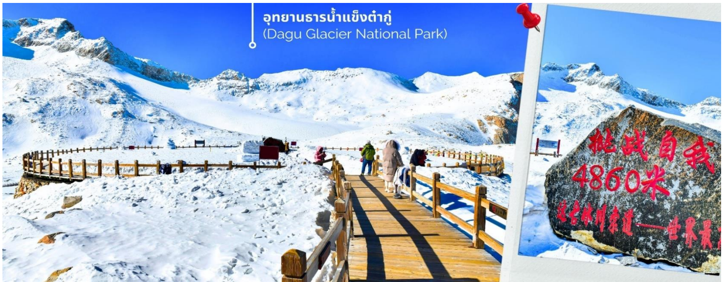
ความหนาวของหิมะขึ้นอยู่กับสภาพอากาศ

จากนั้นนำท่านเดินทางสู่ เมืองเฮยสุ่ย (ใช้เวลาเดินทางประมาณ 2 ชั่วโมง)เพื่อเดินทางไปยัง อุทยานธารน้ำแข็งต้ากู่ (รวมกระเช้าขึ้นลง) ต้ากู่ปิงชว่น หรือ Dagu Glacier National Park เป็นธารน้ำแข็งกลางเขี้ยวที่สวยงามที่สุดแห่งหนึ่งของโลกและเป็นสถานที่ท่องเที่ยวระดับ 4A ของจีน ตั้งอยู่ที่เมืองเฮยสุ่ย ในมณฑลเสฉวน ห่างจากเมืองเฉิงตู ประมาณ 300 กิโลเมตร ถือเป็นธารน้ำแข็งที่อายุน้อยที่สุด ที่ตั้งอยู่ในระดับความสูงที่ต่ำที่สุดและอยู่ใกล้กับเมืองมากที่สุด ในบรรดาธารน้ำแข็งทั้งหมด โดยอยู่สูงจากระดับน้ำทะเลประมาณ 3,800-5,100 เมตร จุดสูงที่สุดที่นักท่องเที่ยวสามารถขึ้นไปได้จะอยู่ที่ 4,860 เมตร