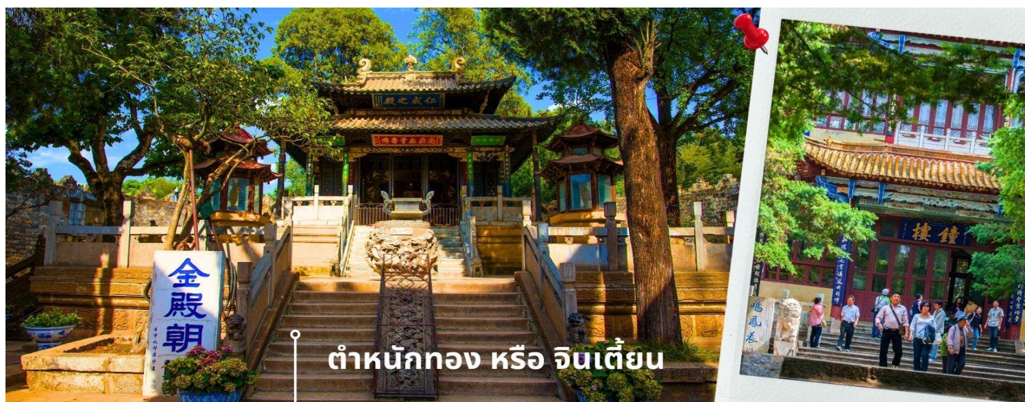
ท่าหนังกอง หรือ จินเตี้ยน