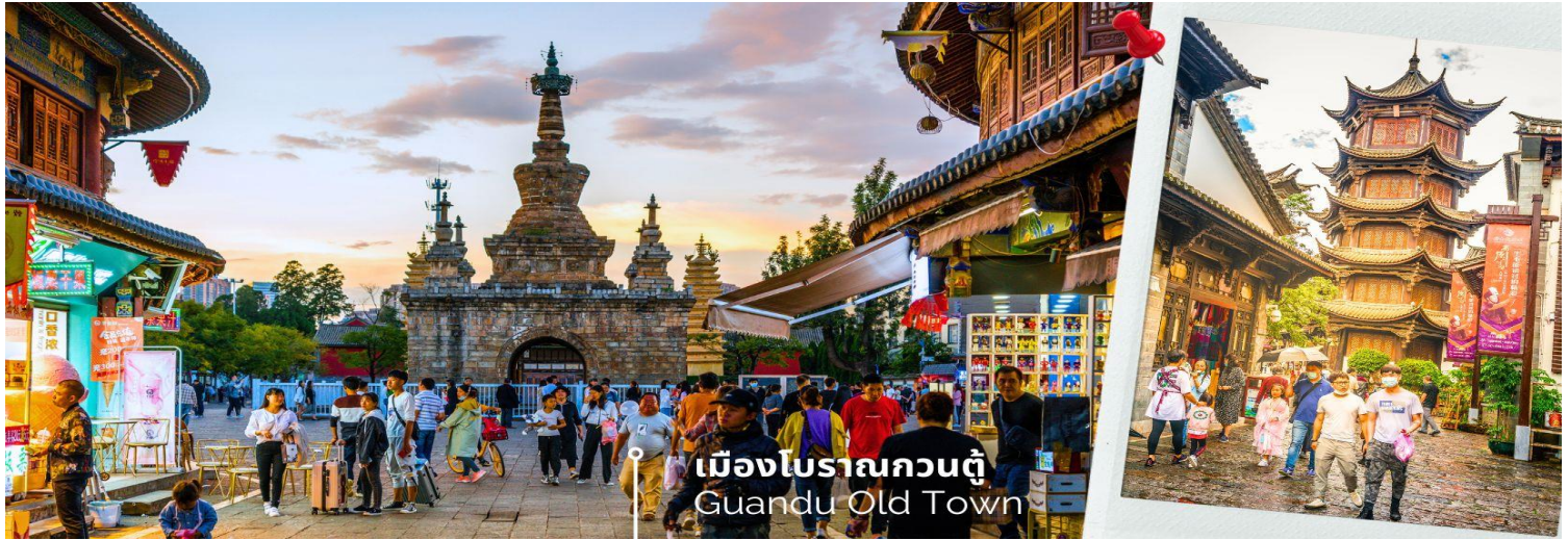
เมืองโบราณกวนตุ๋ Guandu Old Town

นำท่านชมบรรยากาศ เมืองโบราณกวนตุ๋ (Guandu Old Town) เป็นหนึ่งในต้นกำเนิดของวัฒนธรรมยูนนาน และยังเป็นหนึ่งในภูมิทัศน์ทางประวัติศาสตร์และวัฒนธรรม ที่สำคัญของเมืองคุนหมิง เมืองโบราณแห่งนี้ยังคงเป็นศูนย์กลางทางการค้าและคมนาคมที่สำคัญ ในอดีตเคยเป็นหมู่บ้านชาวประมงในสมัยราชวงศ์ถัง เมืองกวนตุ๋ยังเป็นเมืองแรกๆ ที่ศาสนาพุทธทางไนทิเบตได้เริ่มเผยแพร่เข้ามาในดินแดนยูนนาน