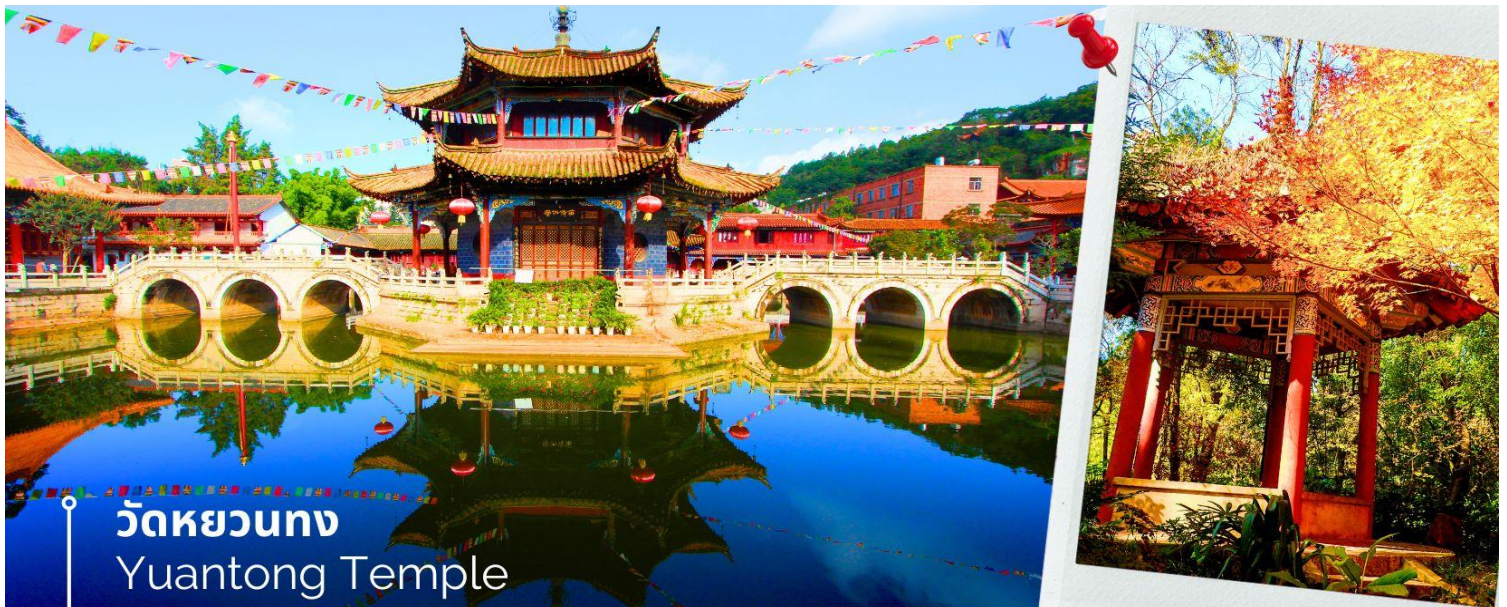
วัดหยวนตง Yuantong Temple

นำท่านชม วัดหยวนตง (Yuantong Temple) วัดแห่งนี้เป็นวัดที่ใหญ่และเก่าแก่ที่สุดในเมืองคุนหมิง สร้างมาตั้งแต่สมัยราชวงศ์ถัง มีอายุยาวนานประมาณ 1,200 กว่าปี การสร้างวัดแห่งนี้จะแปลกตากว่าวัดอื่นในจีน เพราะปกติแล้วการสร้างวัดของจีนส่วนมากจะต้องสร้างอยู่บนภูเขา แต่วัดหยวนตงสร้างวัดต่ำกว่าภูเขา โดยวิหารจะอยู่ต่ำที่สุด เนื่องจากวัดแห่งนี้ไม่ได้สร้างขึ้นเพื่อเป็นวัดโดยตรง แต่เคยเป็นศาลเจ้าแม่กวนอิมมาก่อน