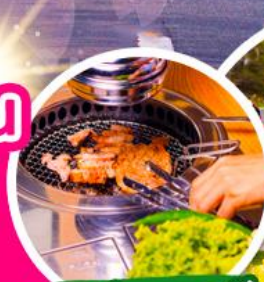
หมูย่างเกาหลี