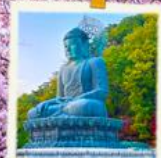
วัดชินอิงซา