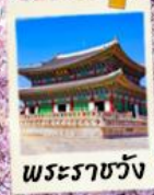
พระราชวัง