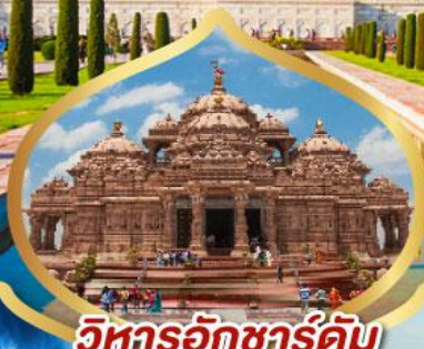
วิหารอักซาร์ดัม