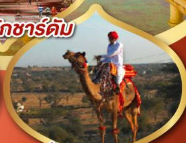
ฟรี ขี่อูฐ เมืองมันทวา ราคาเริ่มต้น