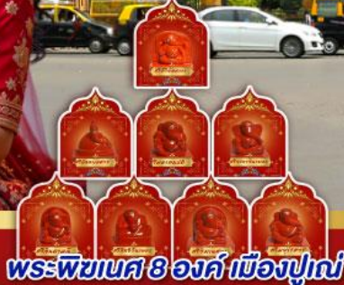
พระพิฆเนศ 8 องค์ เมืองปูणे