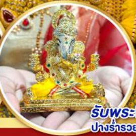
รับพระพิฆเนศปางรำรอยท่านละ 1 องค์