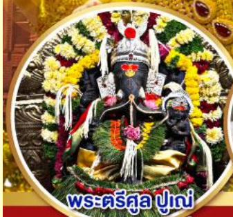
พระตรีศูล ปูणे (Trishul Pune)