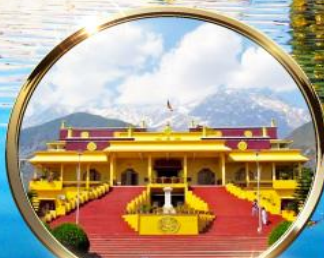
ดาริมซาล่า "ธรรมศาลา" ตำหนักองค์ดาไลลามะ