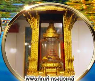
พิพิธภัณฑ์ กรุงนิวเดลี กราบมัสการพระบรมสารีริกธาตุ