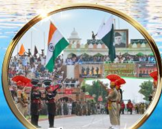
พิธีลดธงชัยแดน อินเดีย-ปากีสถาน ผ่านวาทะ

บินภายในปี-กลับ DEL ATO IXC DEL นั่งรถไฟไม่เหนื่อย