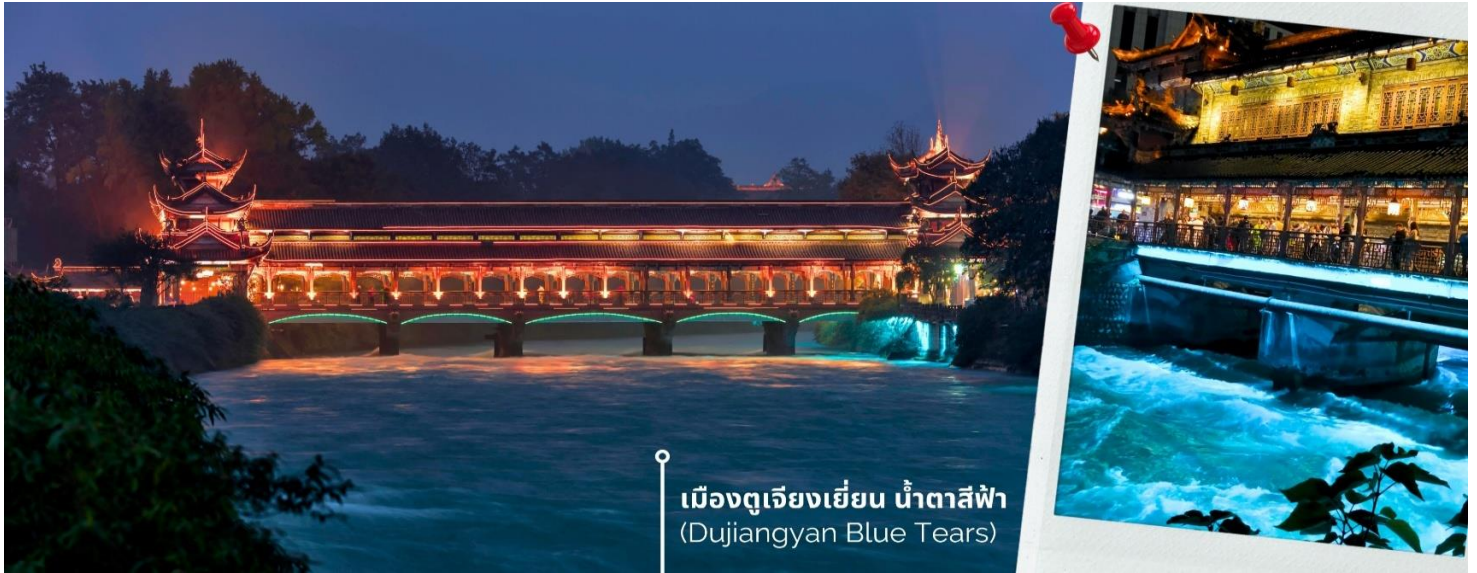
เมืองตูเจียงเยี่ยน น้ำตาสีฟ้า (Dujiangyan Blue Tears)