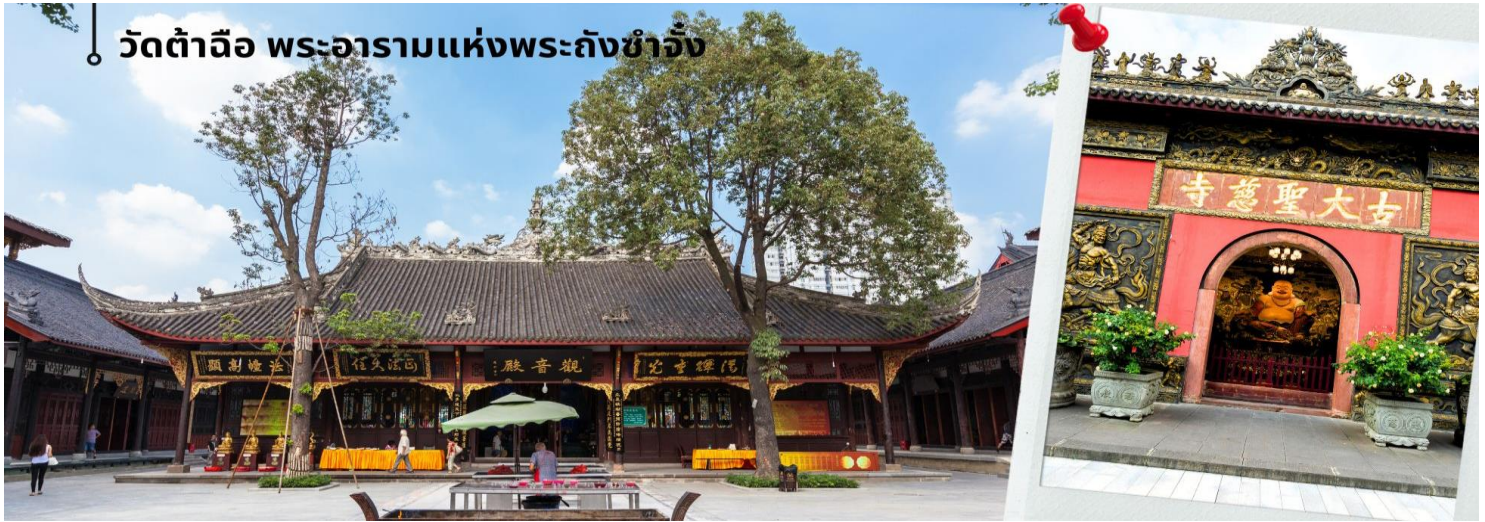
วัดต้าฉือ พระอารามแห่งพระถังซำจั๋ง

นำท่านเดินทางกลับเฉิงตู นำท่านชม วัดต้าฉือ พระอารามแห่งพระถังซำจั๋ง ใจกลางนครเฉิงตู พระถังซำจั๋ง ได้รับการสรรเสริญว่าเป็นผู้มีความเพียร และมีชื่อเสียงมายาวนานกว่า 1,400 ปี และยังได้รับการยกย่องว่าเป็นพระไตรปิฎกแห่งราชวงศ์ถัง พุทธประวัติของพระถังซำจั๋งถูกจารึกในสถานที่ต่างๆมากมาย รวมไปถึงได้ถูกกล่าวถึงในจดหมายเหตุหลายเล่ม ตามเส้นทางการเดินทางแห่งความเพียรของท่าน รวมทั้งมีพระอัฐิของท่าน ประดิษฐานอยู่ในพระอารามของนครนานจิง และที่ทะเลสาบสุริยันจันทราเป็นเกาะไต้หวันอีกด้วย