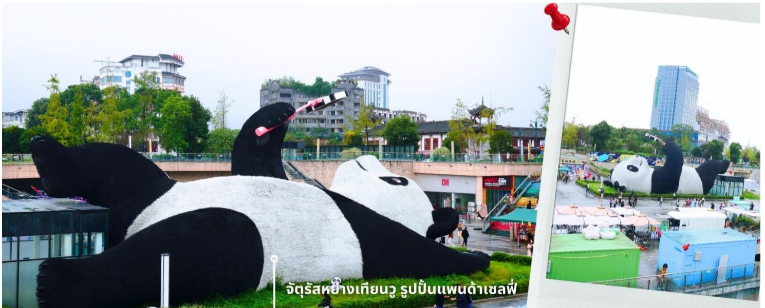
จัตุรัสหยางเทียนวู รูปปั้นแพนด้าเซลฟี่

นำท่านเที่ยวชม จัตุรัสหยางเทียนวู เป็นจุดเช็คอินที่สำคัญสำหรับคนที่มาเที่ยวที่ เมืองตูเจียงเยียน บริเวณจุดท่าข้าม อำเภอตูเจียงเยียน นครเฉิงตู ไฮไลท์ของจัตุรัสหยางเทียนวู คือ ประติมากรรม แพนด้ายักษ์ ที่กำลังนอนหงายท้อง ยื่นมือถือไม้เซลฟี่สีชมพู ซึ่งออกแบบโดยนักออกแบบชื่อดัง Florentijn Hofman รูปปั้นแพนด้า ยักษ์มีความยาว 26 เมตร กว้าง 11 เมตร สูง 12 เมตร และหนัก 130 ตัน แบบท่าทางสบายๆของแพนด้าที่สร้างความประทับใจและ รอยยิ้มให้กับผู้ที่มาเยือนจัตุรัสหยางเทียนวู สามารถดึงดูดนักท่องเที่ยวได้เป็นจำนวนมากเลยทีเดียว เป็นการ แสดงออกด้วยภาษาทางศิลปะแบบหนึ่งที่สะท้อนชีวิตในท้องถิ่น มอบความรู้สึกสนิทสนมและมีความสุขกับผู้ชม อิสระเดินชมถ่ายภาพ รูปปั้นแพนด้าเซลฟี่ ตามอัธยาศัย ที่นี่เป็นจุดเช็คอินที่เหมาะสมสำหรับทุกเพศทุกวัย หากคุณ กำลังมองหาสถานที่ท่องเที่ยวใหม่ๆ ที่เต็มไปด้วย ความทรงจำดีๆ จัตุรัสหยางเทียนวู คือคำตอบที่สมบูรณ์แบบ