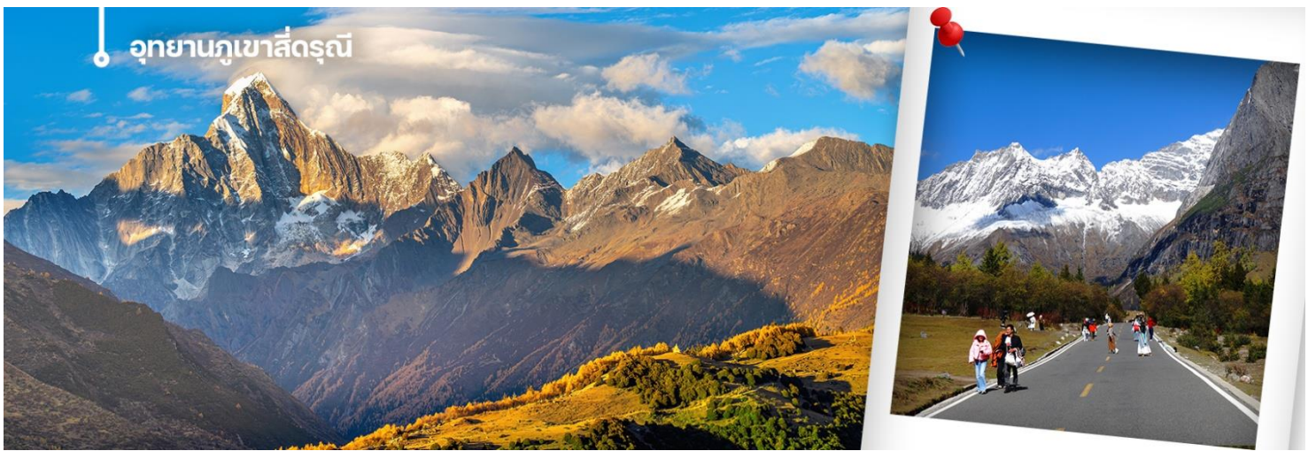
อุทยานภูเขาสี่ครุณี

นำท่านเดินทางสู่ อุทยานภูเขาสี่ครุณี (Mount Siguniang หรือ Four Girls Mountain) หรือชื่อเรียกในภาษาจีนว่า 'ซื่อกุหนิงชาน' (เดินทางใช้เวลาเดินทางประมาณ 3-4 ชั่วโมง) อยู่สูงกว่าระดับน้ำทะเลราว 5,000 เมตร ตั้งอยู่ในอำเภอเสี่ยวจิน เขตปกครองตนเองชนชาติทิเบตและเซียงอาป่า มณฑลเสฉวนทางตะวันตกเฉียงใต้ของจีน ห่างจากนครเฉิงตูราว 220 กิโลเมตร เป็นส่วนหนึ่งของอุทยานฉางผิง ชาวทิเบตเรียกขานกันในนามเทพศักดิ์สิทธิ์ "Skola" ซึ่งแปลว่า "เทพเจ้าผู้ปกป้องรักษา" เป็นหุบเขาที่งดงามจนได้รับการขนานนามว่า ภูเขาแอลป์แห่งเมืองเสฉวน ด้วยลักษณะรูปทรงของยอดเขาสี่ลูกที่เรียงรายติดกัน เมื่อมองจากระยะไกลจะเห็นยอดเขาปกคลุมไปด้วยหิมะขาวโพลน ดูคล้ายกับสี่สาวงามกำลังสวมผ้าคลุมศีรษะ ยืนเรียงรายกันอย่างสง่างาม จึงเป็นที่มาของชื่ออันไพเราะนี้