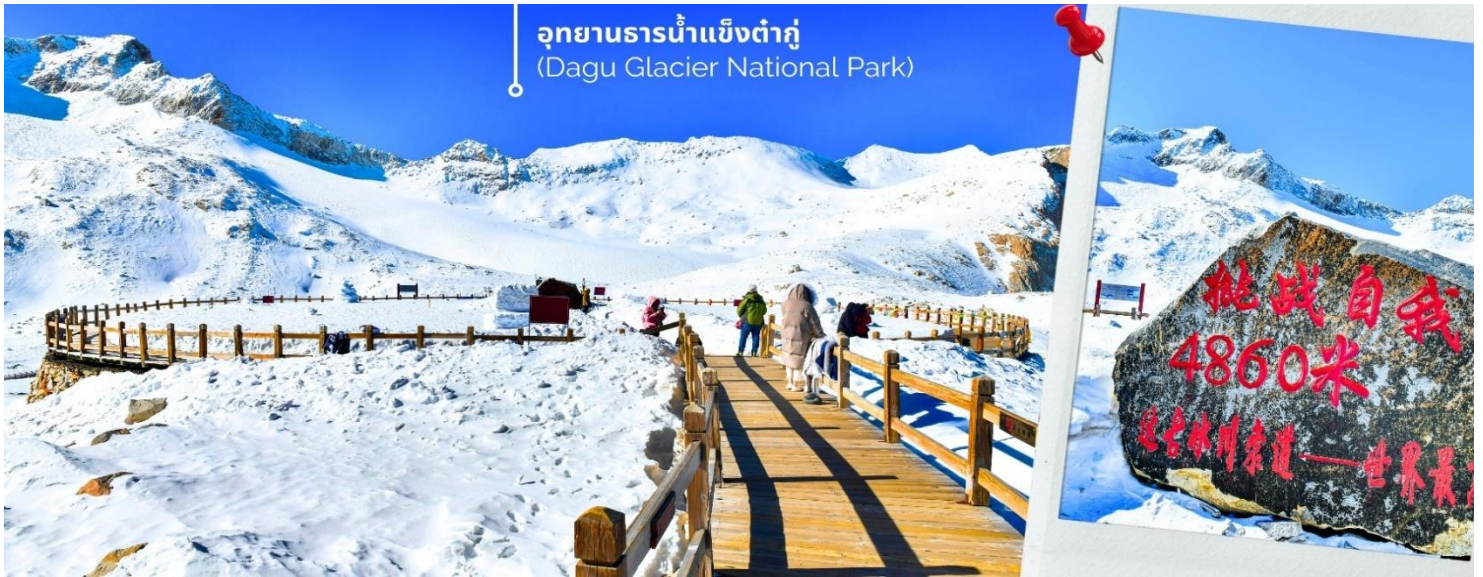
การตกและความหนาวของหิมะขึ้นอยู่กับสภาพอากาศ

จากนั้นนำท่านเดินทางสู่ เมืองเฮยสุ่ย (ใช้เวลาเดินทางประมาณ 2 ชั่วโมง) เพื่อเดินทางไปยัง อุทยานธารน้ำแข็งต้ากู่ปิงชวน(รวมกระเช้าขึ้นลง) ต้ากู่ปิงชวน หรือ Dagu Glacier National Park เป็นธารน้ำแข็งกลาเซียร์ที่สวยงามที่สุดแห่งหนึ่งของโลก และเป็นสถานที่ท่องเที่ยวระดับ 4A ของจีน ตั้งอยู่ที่เมืองเฮยสุ่ย ในมณฑลเสฉวน ห่างจากเมืองเฉิงตูประมาณ 300 กิโลเมตร ถือเป็นธารน้ำแข็งที่อายุน้อยที่สุด ที่ตั้งอยู่ในระดับความสูงที่ต่ำที่สุด และอยู่ใกล้กับเมืองมากที่สุดในบรรดาธารน้ำแข็งทั้งหมด โดยอยู่สูงจากระดับน้ำทะเลประมาณ 3,800-5,100 เมตร จุดสูงที่สุดที่นักท่องเที่ยวสามารถขึ้นไปได้จะอยู่ที่ 4,860 เมตร