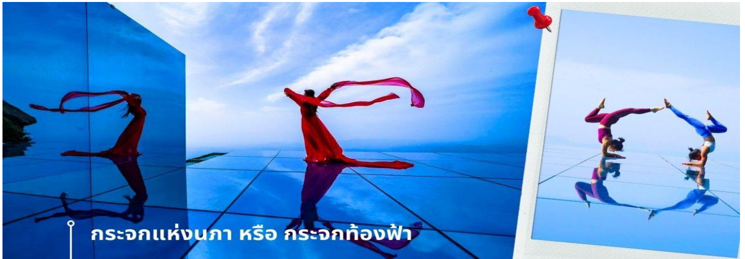
กระจกแห่งนภา หรือ กระจกท้องฟ้า

ตระวันออกเฉียงเหนือของมณฑลเจียงซี จากนั้นพาท่านถ่ายภาพความสวยงามของหุบเขาหลังซาน ในจุดชมวิวและถ่ายภาพที่ได้รับความนิยมจากนักท่องเที่ยวจำนวนมาก นั่นคือ กระจกแห่งนภา หรือ กระจกท้องฟ้า เป็นจุดที่ท่านจะได้ เก็บภาพประทับใจของหุบเขาหลังซานในมุมที่แปลกตา และน่าตื่นตื้น ด้วยมีลักษณะที่เป็นกระจกเงาสะท้อนตัดกับเส้นขอบฟ้า และภูเขาทำให้เกิดภาพที่นำมาหัสศจรรย์