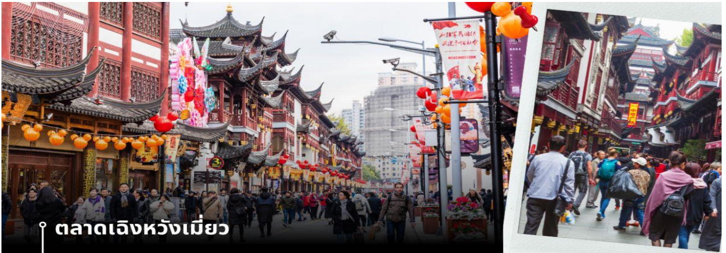
ตลาดเจียงหวงเหมียว

จากนั้นนำท่านเดินทางสู่ย่าน Xin Tian Di (ซิน เทียน ดี) ย่านฮิปเตอร์ใจกลางนครเชียงใหม่ ที่วัยรุ่นต้องเช็คอิน จนกลายเป็นสถานที่ท่องเที่ยวติดอันดับต้นๆไปแล้ว สำหรับแหล่งช้อปปิ้งแห่งนี้ ไม่แพ้แหล่งช้อปปิ้ง อย่าง ถนนนานกิง ถนนอยู่เจียง Yu Yuan Bazaar ถือว่าเป็นอีก 1 ไฮไลท์เด็ดของนครเชียงใหม่ก็ได้ เนื่องจากมีเอกลักษณ์ไม่เหมือนใคร สิ่งปลูกสร้างที่ใช้วัสดุท้องถิ่น สถาปัตยกรรมแบบ Shikumen (ซิกเหมิน) การผสมผสานระหว่างสถาปัตยกรรมตะวันตกกับจีนเข้าด้วยกัน ทางเดินหิน กำแพงหิน ประติมากรรม บ้านเมืองเก่าแต่มีการดูแลรักษาอย่างดี เหมาะสำหรับมาเดินแบบชิๆขี้ๆ นำท่านแวะช้อปปิ้ง ตลาดร้อยปีเจียงหวงเหมียว หรือ ตลาดร้อยปีเชียงใหม่ เป็นตลาดเก่าของผู้ตั้ง เมืองเชียงใหม่ อาคารบ้านเรือนบริเวณนี้เป็นสถาปัตยกรรมโบราณสมัยราชวงศ์หมิงและราชวงศ์ชิง ตกแต่งสไตล์สถาปัตยกรรมแบบโบราณจีน เก่าแก่กว่าร้อยปี ที่ยังคงความงดงาม ทั้งร้านขายอาหาร ร้านขนมพื้นเมืองอาหารขึ้นชื่อของที่นี่คือ เสี่ยวหลงเปา อันลือชื่อ และยังมีขายของที่ระลึกต่างๆมากมาย