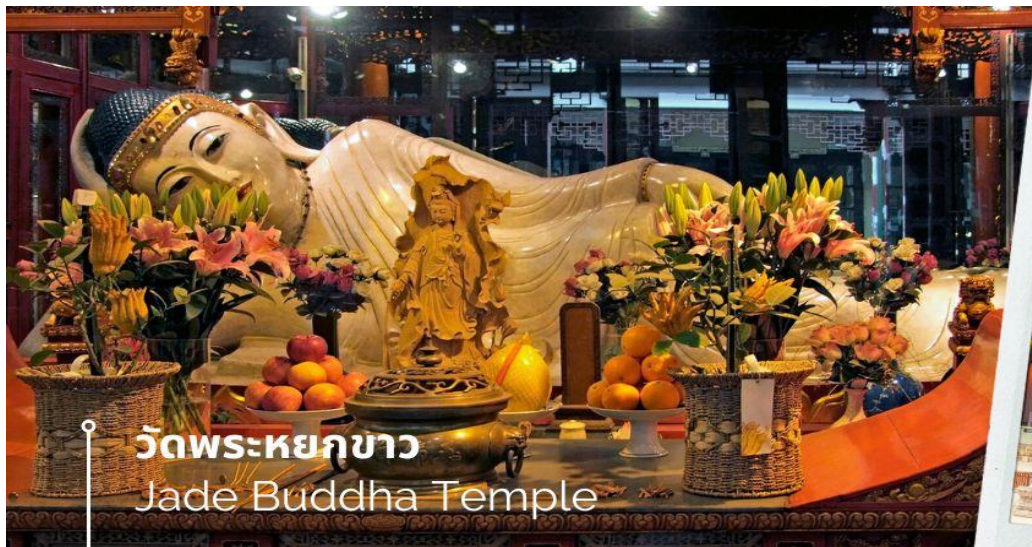
วัดพระหยกขาว Jade Buddha Temple

เช้า 📍 รับประทานอาหารเช้า ณ ห้องอาหารโรงแรม (12) นำท่านชม วัดพระหยกขาว เป็นวัดที่มีชื่อเสียงมากที่สุดในเมืองเชียงใหม่ ซึ่งเป็นที่รู้จักจากพระพุทธรูปสององค์ที่สร้างขึ้นจากหยกทั้งแท่ง องค์พระพุทธรูปปางนั่งมีความสูง 190 เซนติเมตร และ หุ้มด้วยเพชรพลอย หิน มโนรา และ