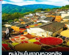
หมู่บ้านโบราณหวงหลิง (หมู่บ้านตากฟ้า)