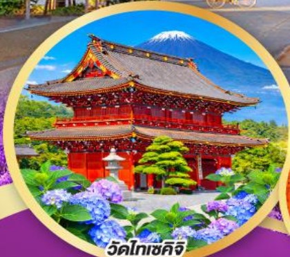
วัดโทเซคิจิ