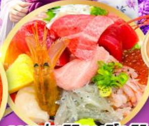
ตลาดปลาซิมิสึ คาชิโนะอิชิ