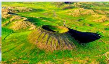
อุทยานภูเขาไฟอูลันฮาตา