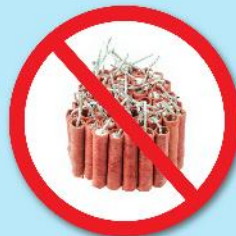
พลุ, ประทัด