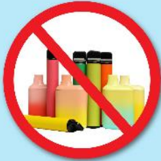
ปืนไฟฟ้า บุหรีไฟฟ้า