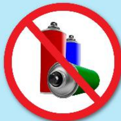
ขวดสเปรย์