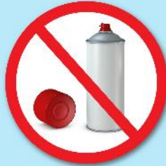
กระป๋องสเปรย์