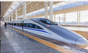
รถไฟความเร็วสูง

*ทางบริษัทฯ ขอสงวนสิทธิ์ในการสลับโปรแกรมทัวร์ตามความเหมาะสมขึ้นอยู่กับสถานการณ์หน้างาน โดยคำนึงถึงผลประโยชน์ของลูกค้าเป็นสำคัญ