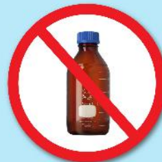
ขวดสารเคมี