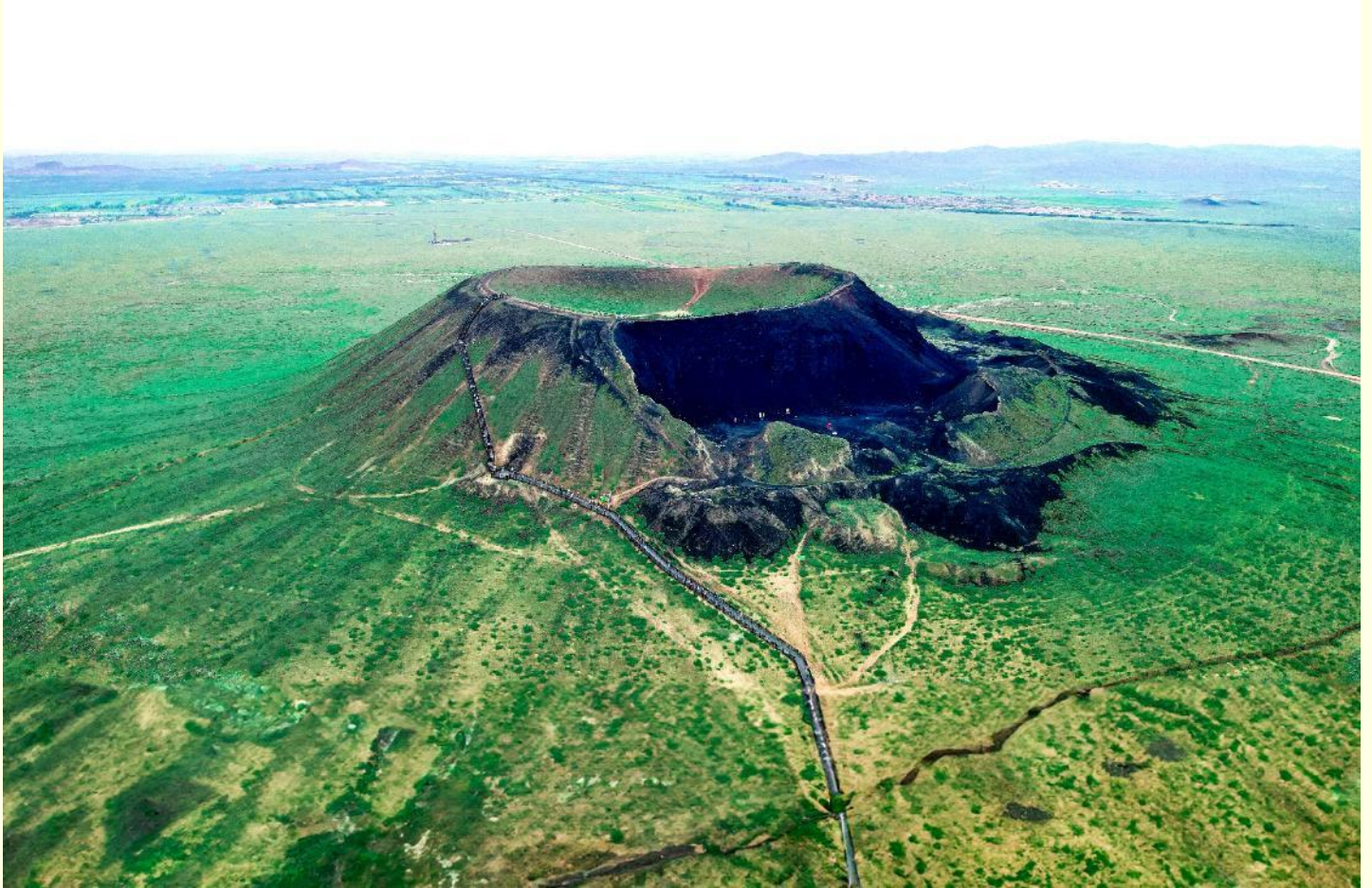
ทิวทัศน์แห่งนี้

นักท่องเที่ยว อุทยานภูเขาไฟอุลันฮาดา (Ulanhada Volcanic Geopark) ได้รับการขนานนามว่าเป็น “พิพิธภัณฑ์ภูเขาไฟ” ตามธรรมชาติ โดยมีลักษณะทางธรณีวิทยาที่หลากหลาย ไม่ว่าจะเป็นภูเขาไฟทุ่งลาวา และทะเลสาบสันดอนกัน ความงามของธรรมชาติบนอุทยานธรณีภูเขาไฟอุลันฮาดาที่ได้รับการกล่าวขานและขยายเป็นวงกว้าง ทำให้นักท่องเที่ยวจำนวนมากเดินทางมาเยี่ยมชม