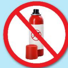
ขวดน้ำยา ฆ่าแมลง