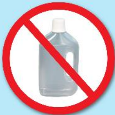
ขวดน้ำยา