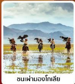
ชนเผ่ามองโกเลีย