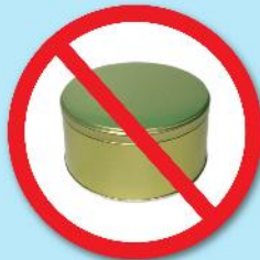
กล่องโลหะ