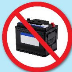
แบตเตอรี่ดำ