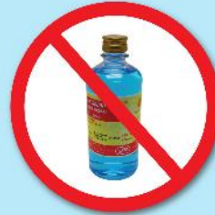
ขวดแอลกอฮอล์