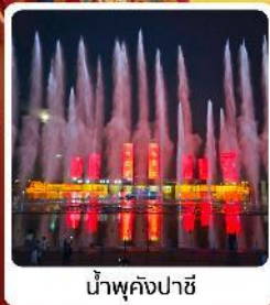
น้ำพุคังปาซี

● ไอลท์ เป็นสายการบินชาวจีน แล่งท่องเที่ยวระดับ 5A ของจีน ภูเขาไฟอูลันฮาตา น้ำพุคังปาซี น้ำพุที่สูงที่สุดในเอเชีย