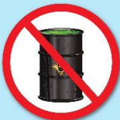
สารกัมมันตรังสี