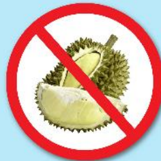
ผลไม้เขตร้อน ที่มีหนาม