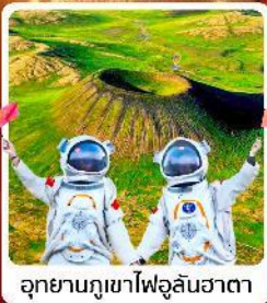
อุทยานภูเขาไฟอูลันฮาตา