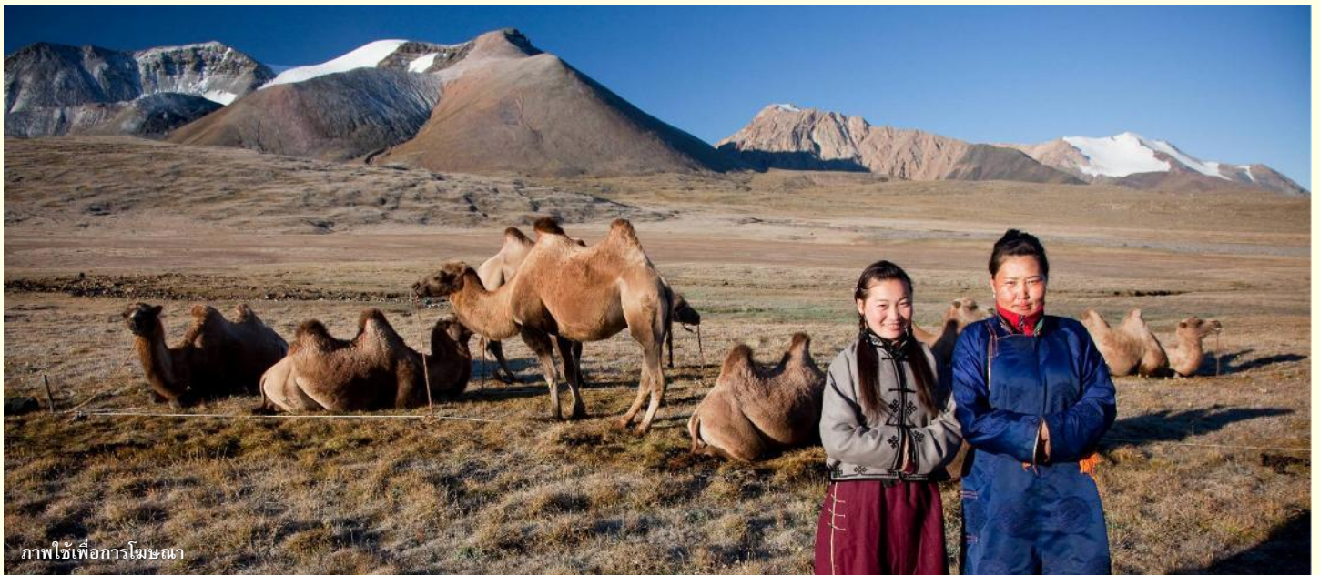
ภาพใช้เพื่อการโฆษณา

นำท่านร่วมกิจกรรม พิธีต้อนรับแขกสไตล์มองโกล เป็นประเพณีโบราณที่มีมาช้านาน ชาวมองโกลมีอุปนิสัยที่รักเพื่อนฝูงและตรงไปตรงมาไม่เสแสร้ง เมื่อมีเพื่อนหรือแขกมาเยือนก็มักจะผูกมิตรอย่างจริงใจ และนำท่านร่วมกิจกรรม สวมใส่ชุดมองโกล สัมผัสพลังแห่งบรรพบุรุษ สวมเสื้อคลุมแบบดั้งเดิมที่มีสีสันสดใส ปักลวดลายอันประณีต คุณจะสัมผัสได้ถึงพลังแห่งบรรพบุรุษที่เคยปกครองดินแดนครึ่งโลก การสวมหมวกขนสัตว์ ผูกสายรัดเอว พร้อมเครื่องประดับเงินแท้ที่ส่องแสงระยิบระยับ จะทำให้ท่านเสมือนกลายเป็นนักรบแห่งทุ่งหญ้า พร้อมเครื่องประดับเงินแท้ที่ส่องแสงระยิบระยับ ของชนเผ่าที่เคยปกครองดินแดนครึ่งโลก เมื่อคุณยืนท่ามกลางทุ่งหญ้าไร้ขอบเขต