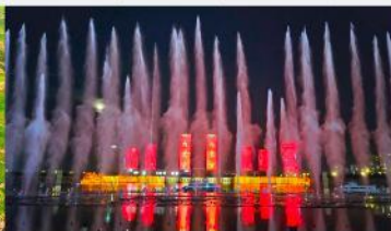
น้ำพุคังปาซี