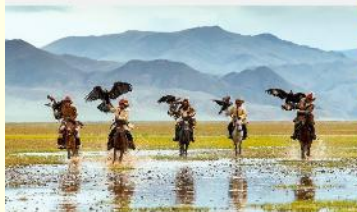
ชนเผ่ามองโกเลีย