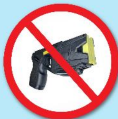
ปืนซ็อตไฟฟ้า